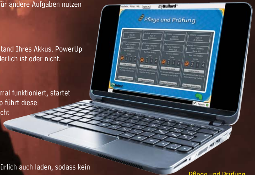
Pflege und Prüfung

* Für jeden zusätzlichen parallel laufenden Ladevorgang ist ein separates PowerUp Ladegerät erforderlich.